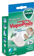
Vicks Rosemarijn & Lavendel VapoPads (7 pcs) VBR7E