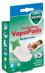
Vicks Menthol VapoPads (7 pcs) VH7