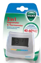
Vicks 2-1 Hygrometer & Thermometer V70EMEA