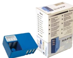
Ontkalkings Patroon ACA-817E